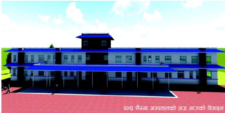
पन्ध्र शैर्या अस्पतालको अग्र भागको डिजाइन ।